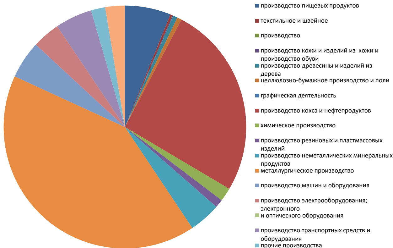
Рис. 2. Структура обрабатывающих производств в УрФО по виду экономической деятельности

В зону риска попадают текстильная, кожевенно-обувная и швейная промышленности.